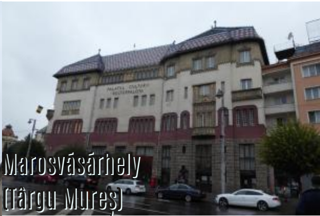
Marosvásárhely (Hârgu Mureş)